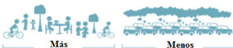
Figura tomada de: https://www.walkscore.com/about.shtml

Una de las principales preocupaciones de la Agenda Urbana de ONU Habitat gira en torno a la capacidad que tienen los centros urbanos para mitigar y adaptarse a las consecuencias del cambio climático. No hay país en el mundo “que no haya experimentado los dramáticos efectos del cambio climático. Las emisiones de gases de efecto invernadero continúan aumentando y hoy son un 50 por ciento superior al nivel de 1990. Además, el calentamiento global está provocando cambios permanentes en el sistema climático, cuyas consecuencias pueden ser irreversibles si no se toman medidas urgentes” 5 . En función de esta problemática global, las ciudades más vanguardistas han venido tomando medidas para la promoción del